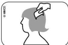
Abb. Durchkämmen des nassen Haares mit Läusekamm vom Haaransatz bis zu den Haarspitzen